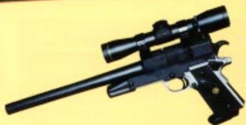
RAPTOR A XTENDER /18/